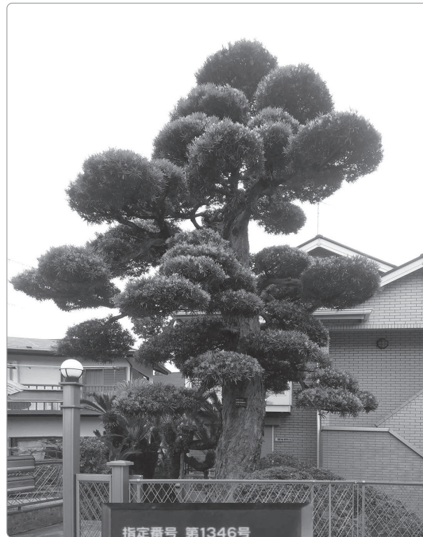
指定番号 第1346号 大田区保護樹木 マキ 平成23年4月20日指定