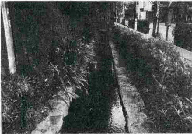
現在の六郷用水(田園調布南24番付近)↓

せ、現在子供二人に恵まれ円満な家庭生活を日々送っております。私にとって忘れることの出来ない思い出がございます。平成四年には叙勲をいただきました。これもひとえに地域社会の皆様のお力添えと感謝致しております。犯罪のない明るい社会を願ながら息子夫婦と孫一人共々毎日を大切にしながら頑張りを続けております。(担当者の聞き取りによる。敬称略)