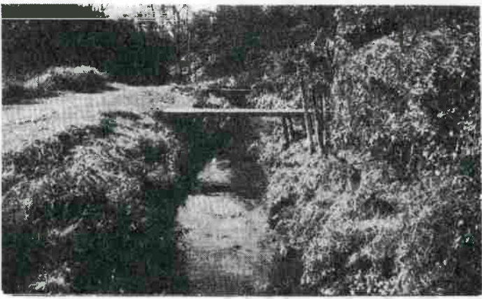
↑昔の面影を残していた頃の六郷用水(昭和23年)

テレビなどで、古い城下町を川が流れている風景を見たりすると、今昔は六郷用水をとりあげまし