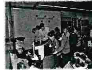
各ブースとも、たくさんの方で賑わいました。