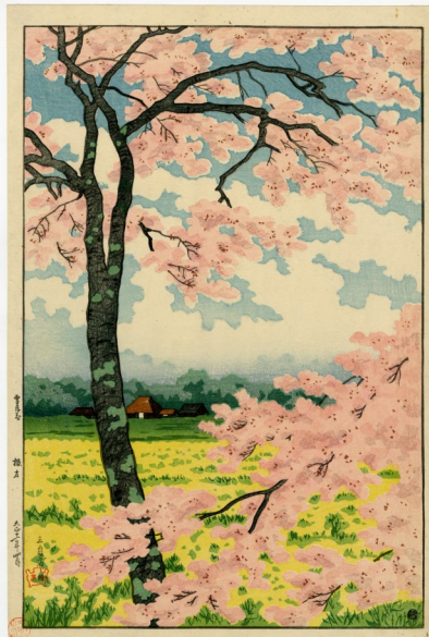
「根方」『雪月花』 高橋松亭 大正11年4月