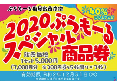
(商品券ポスター例) 梅屋敷梅交会