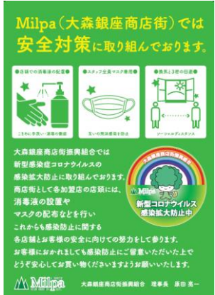
(感染防止啓発広告例) 大森銀座商店街