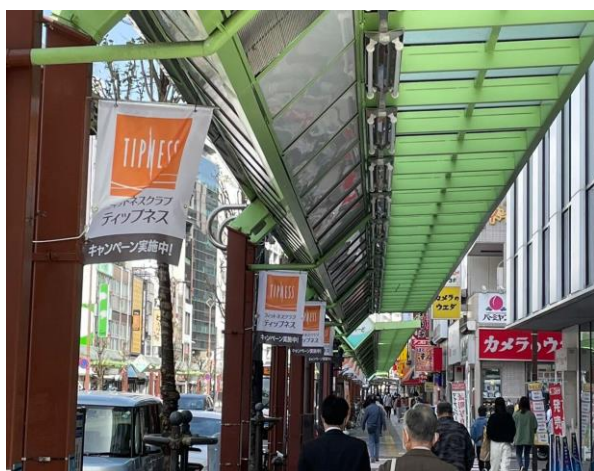
令和5年度、蒲田東口商店街に「TIPNESS」のフラッグ広告が3回掲出予定

令和5年度はこれら取り組みを横展開して、商店街や個店の稼ぐ力の面的な拡大を支援していく。