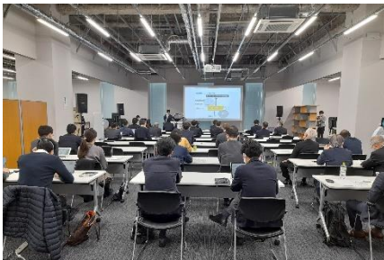
(12/1 開催、大田区・川崎市連携イベント)