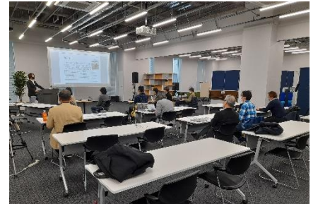
(12/22 開催、東工大生向け起業体験セミナー)