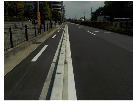
自転車道（東海一丁目）