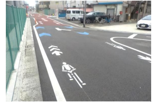
ナビマーク・ナビライン（蒲田本町二丁目）