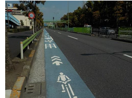
自転車専用通行帯（大森本町一丁目）