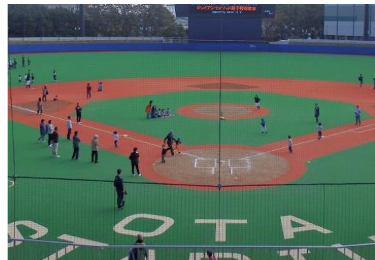
参加者の様子(イメージ)