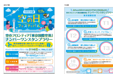
用意した賞品はすべて達成者に提供済