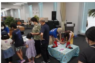
家族連れを中心に缶バッチ作りへ参加