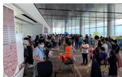
会場は一日を通じてにぎわいをみせた