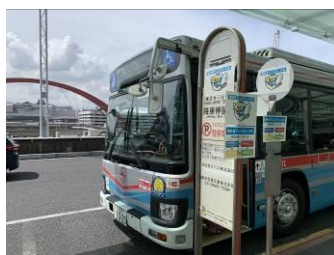
1 時間に 2 本の間隔で運行

(3) スタンプラリー参加者は約 2,600 人に上り、HICity 内のスタンプ設置場所の HANEDA×PiO には行列が発生