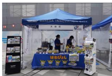
産品以外にははねびょんカプセルトイも設置