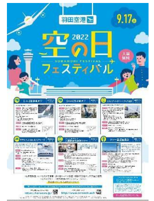
「空の日」フェスティバルチラシ