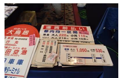
各社趣向を凝らしたオリジナルグッズを販売