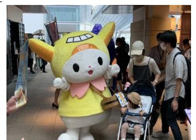
ターミナル内キャラクター行進