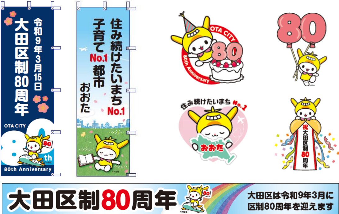
80周年記念事業周知用品の一例