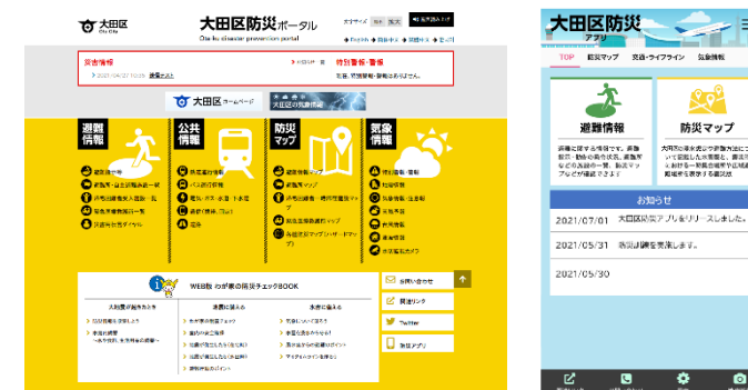
防災ポータルサイトと防災アプリ