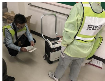
発電機使用訓練の様子