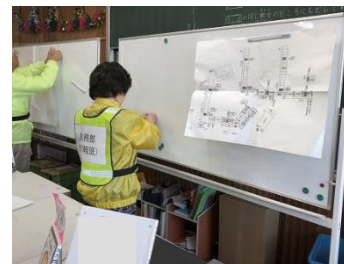
情報伝達訓練の様子

災害時には自治町会員だけでなく、避難者全員が支え合い学校防災活動拠点を運営していくことが大切です。