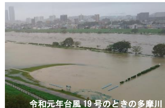
令和元年台風19号のときの多摩川

矢口地区は、多摩川に面し、自然を身近に感じることができる環境が特徴ですが、地理的要因や低地部に位置していることから多摩川の氾濫や高潮被害という自然災害のリスクが高いという特徴もあわせ持ちます。豊かな自然と共に生活していくために、矢口地区の水害リスクを知り、自分を守る方法を確認しましょう。