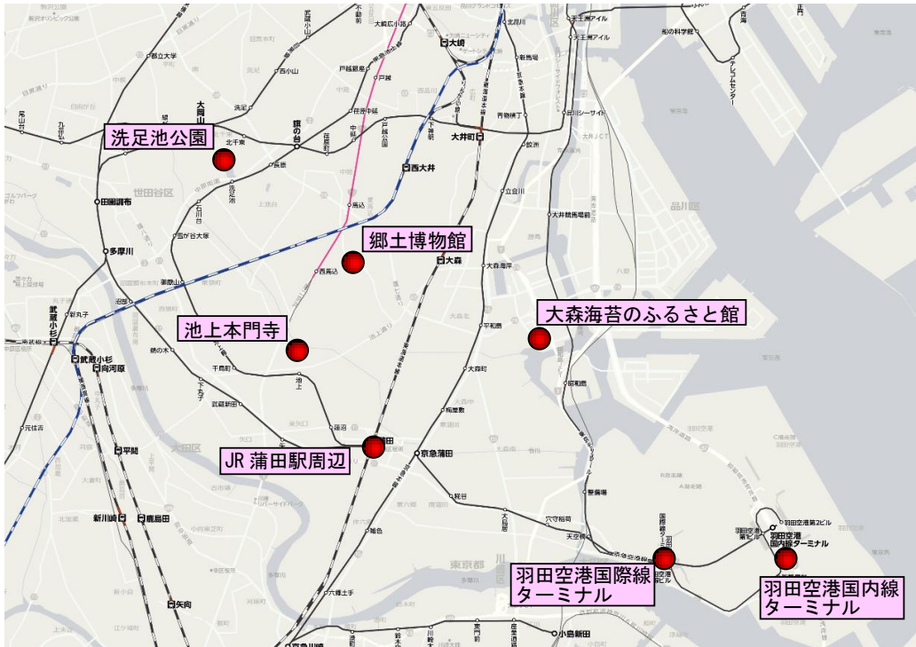
図表 1-6 来訪者アンケート調査箇所