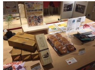
※写真は昨年の様子です。