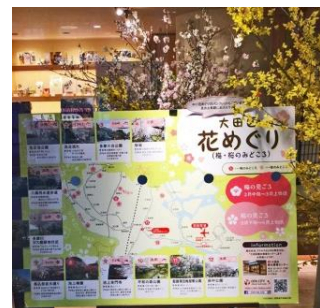
※昨年の展示の様子