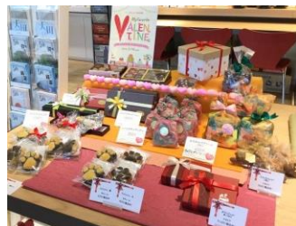
※写真は昨年の様子です