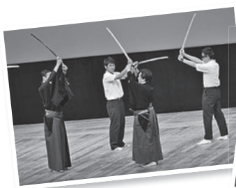
Giao tranh tachimawari

Vui lòng xem trang chủ để biết thêm chi tiết.