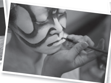
Thực diễn hóa trang