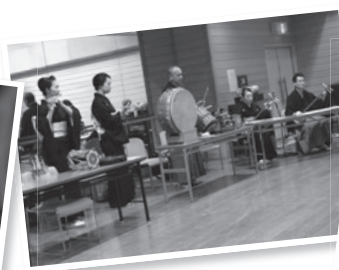
Âm nhạc trong Kabuki