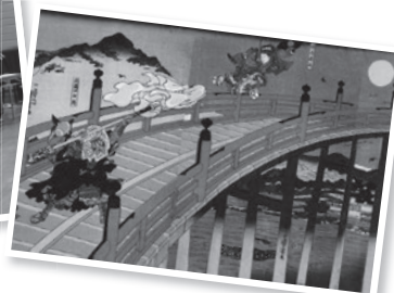
Tranh phù thể Cầu Gojo