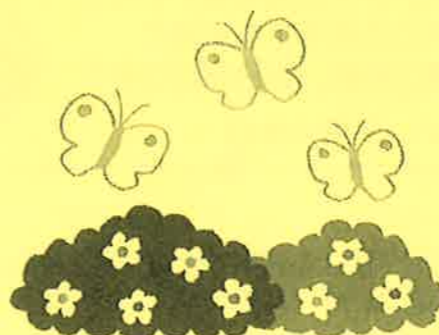
相談 電話: 5705-0738