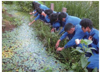
▲ホタル復活プロジェクト

(公社)洗足風致協会が中心となって、約80年にわたって環境保護・育成活動を区と協働しながら行っています。かつては都内にも複数あった「風致協会」のうち、現在残っている唯一の団体で、区内の景観まちづくりの歴史が感じられます。地元中学生と連携し、昭和初期に生息していたホタルを復活させる「ホタル復活プロジェクト」を通じて水質改善にも取り組んでいます。