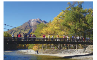
河童橋から焼岳方面を望む

● 日程と主なコース 7月10・11日(1泊2日) 1日目=午前7時20分蒲田駅出発→笛吹市内(桃狩り)→桔梗屋工場(見学・買い物)→笛吹市内(昼食) 2日目=アグリビレッジとうみ(買い物)→河童橋駐車場(散策・弁当)→蒲田駅午後8時15分到着予定