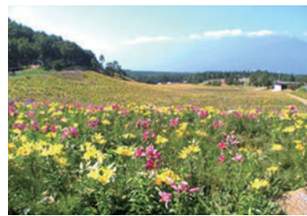
車山高原のニッコウキスゲ

● 日程と主なコース 7月18・19日(1泊2日) 1日目=午前7時20分蒲田駅出発→立科町(昼食)→車山高原(散策・リフト乗車) 2日目=アグリビレッジとうみ(買い物)→高橋まゆみ人形館(見学)→飯山市内(昼食)→花の駅千曲川(買い物)→蒲田駅午後6時30分到着予定