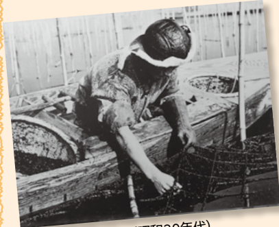
素手で海苔を採る (昭和30年代)