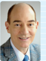
ロバート キャンベル