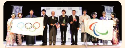
1月9日、新成人の皆さんと。壇上では、オリンピック・パラリンピックフラッグを受け取るセレモニーも行われました。

1月9日の成人の日には、無限の可能性を秘めた6,273人が新たな一歩を踏み出しました。未来へ向けた輝かしい一歩であると同時に、望むと望まざるとにかかわらず大人としての社会的責任を負う一歩でもあります。失敗をしない人はいません。私も失敗をてこに努力をし続けてきました。失敗をもやろがいと前向きに捉え、果敢に新たなことに挑戦する一年としていきたいものです。