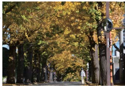
11月下旬のイチヨウ並木

11月下旬、田園調布駅から続くイチヨウ並木が黄色く色づき、カメラを手に散策を楽しむ人がひっきりなしに訪れていました。イチヨウ並木は田園調布駅西口から放射状に伸びる3本の街路沿いに整備されています。その左側の街路を進むと5分ほどで宝来公園に達します。宝来公園は2月にはウメ、3月には桜を楽しむことができる花名所となっています。また、高低差のある園内はぐるりと遊歩道がめぐっており、梅林を抜けると大きなケヤキやムクノキの眼下に、カモが憩う湧水池が見渡せます。花や木々を楽しみながら、ゆっくり散策をしてみませんか。