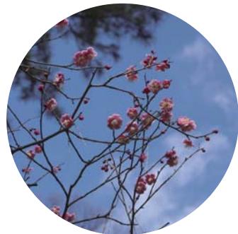
宝来公園のウメ (例年の見頃:2月下旬)

11月下旬、田園調布駅から続くイチヨウ並木が黄色く色づき、カメラを手に散策を楽しむ人がひっきりなしに訪れていました。イチヨウ並木は田園調布駅西口から放射状に伸びる3本の街路沿いに整備されています。その左側の街路を進むと5分ほどで宝来公園に達します。宝来公園は2月にはウメ、3月には桜を楽しむことができる花名所となっています。また、高低差のある園内はぐるりと遊歩道がめぐっており、梅林を抜けると大きなケヤキやムクノキの眼下に、カモが憩う湧水池が見渡せます。花や木々を楽しみながら、ゆっくり散策をしてみませんか。