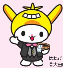
はねびよん ©大田区