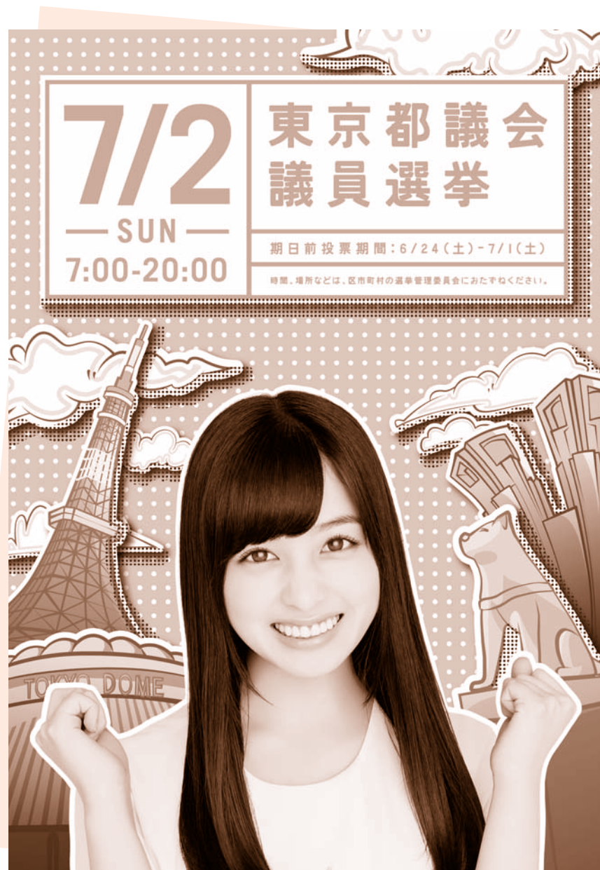
東京都議会議員選挙 啓発ポスター

投票所入場整理券が投票日までに届かなかった場合でも、選挙人名簿に登録されていれば投票できます。投票所でその旨を係員にお伝えください。登録の有無は大田区選挙管理委員会事務局へお問い合わせください。