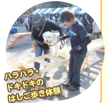
ハラハラ・ドキドキのはしご歩き体験

📍池上本門寺特設広場(第二駐車場) 当日会場へ(犬の同伴可、犬鑑札・注射済票を装着)