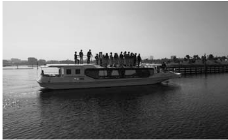
図10月14・21日(出)午前10時～正午 ●集合場所 大森ふるさとの浜辺公園レストハウス ●コース 羽田空港周辺 ●運航 東京湾遊漁船業協同組合 費1,000円(小学生500円) 定先着各20名 甲当日集合場所へ(整理券配付) 図都市計画課計画調整担当 ☎090-5782-6467(問合せ専用) FAX5744-1530(運航日前日まで)