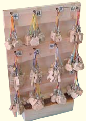
木工製品 (くすのき園)