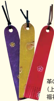
革のしおり (上池台障害者福祉会館)

わかりあいは ふれあいから ☎10月22日(日)午前10時～午後3時 ☎上池台障害者福祉会館 ☎3728-3111 FAX3726-6677 ※開催日が11月19日(日)に変更となりました