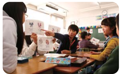
班で意見を共有(梅田小学校6年生)