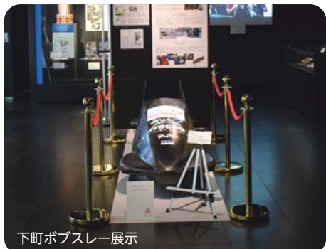
カーリングストーンは20キロもあります