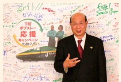
応援フラッグの前でポブピース

そうした何事にも積極果敢にチャレンジし続ける姿は、きっと家族や友人・知人も応援してくれるはずですよ。