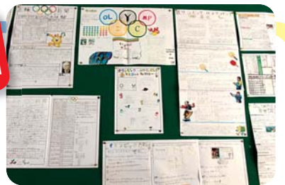
オリンピック・パラリンピック新聞を作成