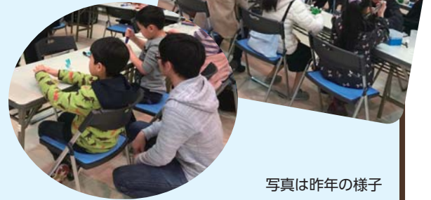
写真は昨年の様子