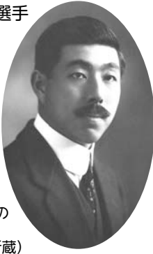
大学時代の三島弥彦(三島家所蔵)