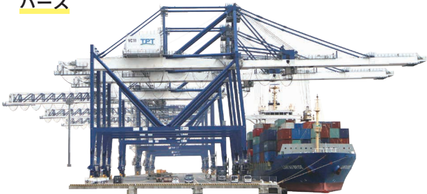
▲コンテナを積み降ろすガントリークレーン(左)と大型船(右)。Y2は、海上コンテナ14,000個分の量を運ぶ大型船にも対応