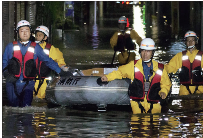
▲区内の浸水被害 (令和元年10月13日撮影)