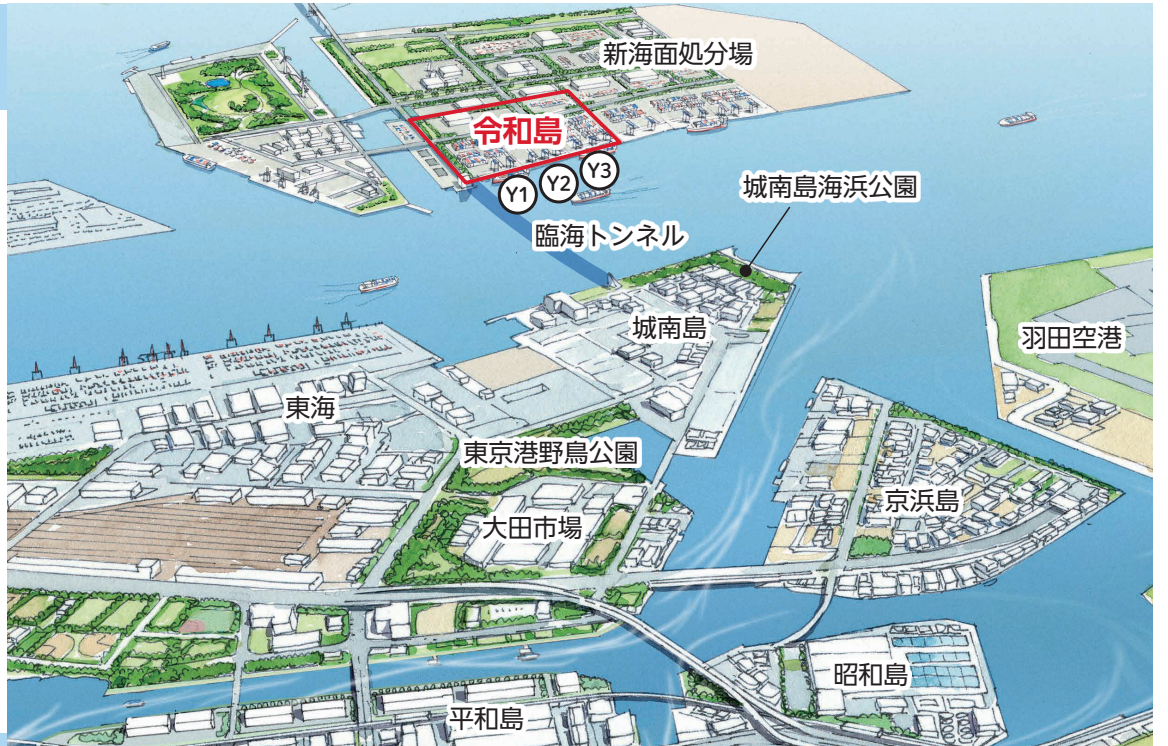
(おおた都市づくりビジョンまちの将来イメージから抜粋)