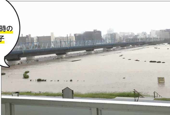
▲多摩川 (令和元年10月12日撮影)