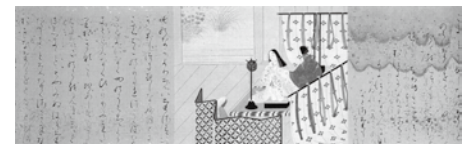
熊谷恒子「竹取物語」(部分)1934年頃

☎ 10月11日(日)まで ●入館料 100円(子ども50円)。65歳以上(要証明)と5歳以下は無料 ※休館日はお問い合わせください ☎ 熊谷恒子記念館 ☎ FAX 3773-0123