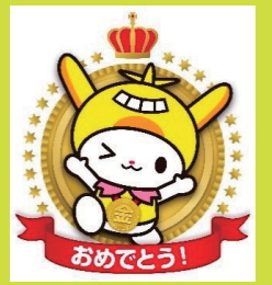
金メダルスタンプ

メダルを持ったはねぴょんスタンプを集めると、はねぴょんと一緒に写真撮影などができるキャンペーンに応募できます。メダルのランクが上がると、当選確率が上がります。