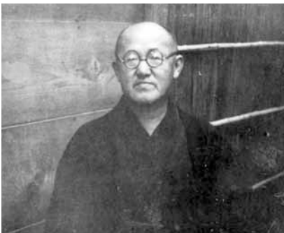
▲昭和15年夏の川瀬巴水