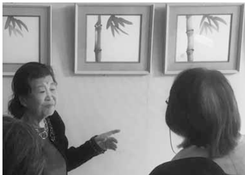
▲受講生作品の講評風景(昨年度)