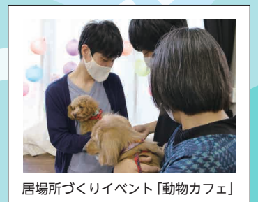
居場所づくりイベント「動物カフェ」