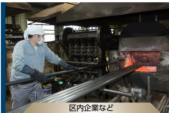
区内企業など 16社と協力して開発