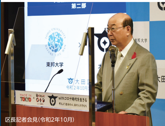
区長記者会見(令和2年10月)