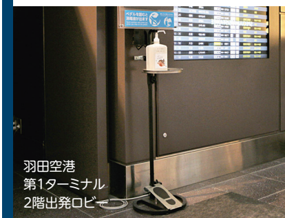
羽田空港 第1ターミナル 2階出発ロビー