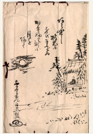
ふりょうろう かつこきち しがさん 不量老(勝小吉)自画像