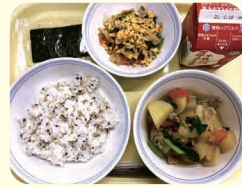
◀ごまごはん・牛乳・焼き海苔・大根と豚肉のべっこう煮・千草和え

毎年2月6日は「海苔の日」です。大田区は海苔養殖業発祥の地、ということで焼き海苔を出しました。食材は、大田区の自然や歴史、産業を知るきっかけにもなります。