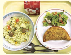
◀コーンピラフ・牛乳・パステウ・ブラジル風コールスロー

「パステウ」は、生地にひき肉などの具材を包んで揚げたブラジル料理。餃子の皮で代用して作ることもできるので、家庭でブラジル気分を味わうこともできますよ。