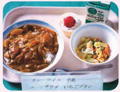
◀カレーライス・牛乳・コーンサラダ・いちごプリン

カレーの定番具材、じゃがいも。みんなが食べているのは実は「根」ではなく「茎」。野菜のどこを食べているか注目してみると、味だけでなく、植物のつくりが詳しくわかります。