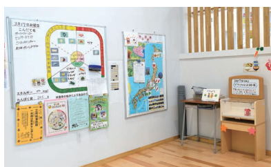
▲志茂田小学校内にある「給食スペース」。その日の食材などの情報を掲示している

志茂田小学校主任栄養教諭。管理栄養士の母の下、食について学ぶことが身近であったことから、食と栄養の専門家を目指す。小学校の教育実習で子どもの素直な反応に感動し栄養教諭に。「子どもたちが食べている時や食の話に興味をもった時のキラキラした笑顔が好き」