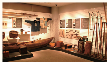
大森 海苔のふるさと館 2階展示室

海苔の生産の歴史を後世に伝えるため「大森 海苔のふるさと館」が平成20年に開設されました。展示・収蔵されている貴重な海苔船や生産用具類881点は、国の重要有形民俗文化財に指定されています。また、海苔つけなどの体験学習を通じて、海苔に関する知識を学ぶことができます。