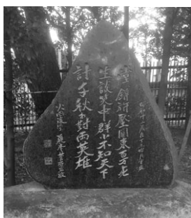
徳富蘇峰が洗足池に建立した両英雄詩碑

期 5月14日(日) ①午前10時～正午②午後2時～4時 会 山王草堂記念館(集合)、勝海舟記念館(解散) 費 300円(65歳以上の方は240円) 定 抽選で各10名 申 問合先へ往復はがき(記入例参照。希