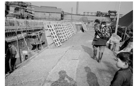
貴船堀で海苔乾し(昭和32(1957)年2月17日)

☎4月18日(火)～8月20日(日)午前9時～午後5時(6～8月は午後7時まで)