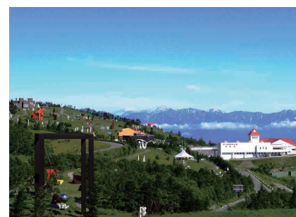
▲美ヶ原高原美術館 全景

▶ 問合せ先 地域力推進課区民施設担当 ☎5744-1229 FAX5744-1518