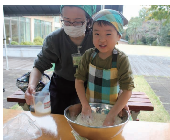
アウトドアクッキング

▶問合せ 地域力推進課区民施設担当 ☎5744-1229 FAX5744-1518