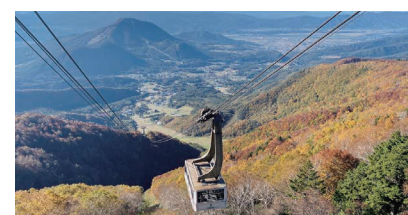
竜王ロープウェイ

▶問合せ先 地域力推進課区民施設担当 ☎5744-1229 FAX 5744-1518