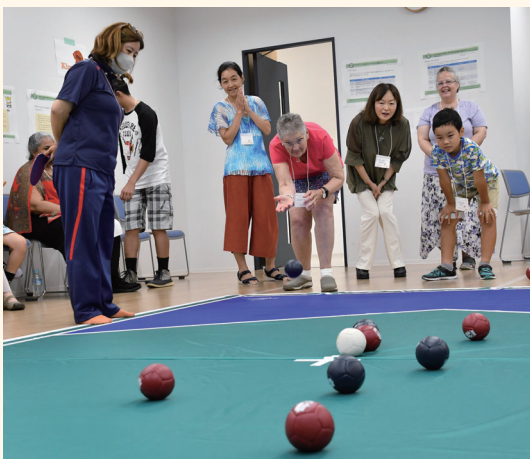
ポッチャを楽しむ参加者たち

7月9日には訪問団との区民交流会が行われ、ポッチャ大会を通して交流を深めました。ポッチャは子どもから大人まで楽しめるスポーツで、言葉が通じない中でも、国境の壁を越えて白熱した戦いが繰り広げられました。最初は少し緊張気味だった参加者たちですが、試合を重ねていくうちに、チームで戦術を練ったり、勝利した時にはハイタッチで喜び合ったりする姿も。交流会の最後には、訪問団の方が「区民の皆さんと交流できて楽しい時間でした。今度はぜひセーラム市に遊びに来てほしいです」と別れを惜しみつつ話していました。