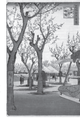
歌川広重 「名所江戸百景 蒲田の梅園」 安政4(1857)年