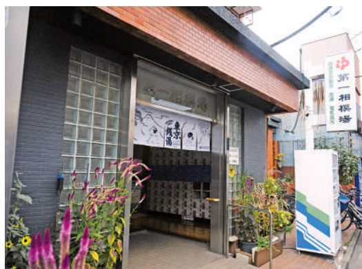
撮影協力: 第一相模湯(西六郷2-29-2)