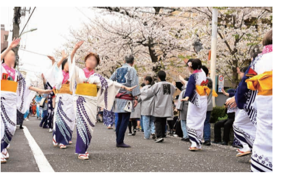
図 馬込特別出張所 TEL 3774-3301 FAX 3774-4997