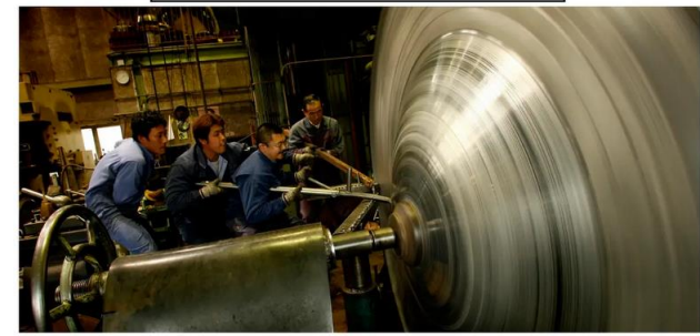
へら絞りで「材料ロス」を減らす