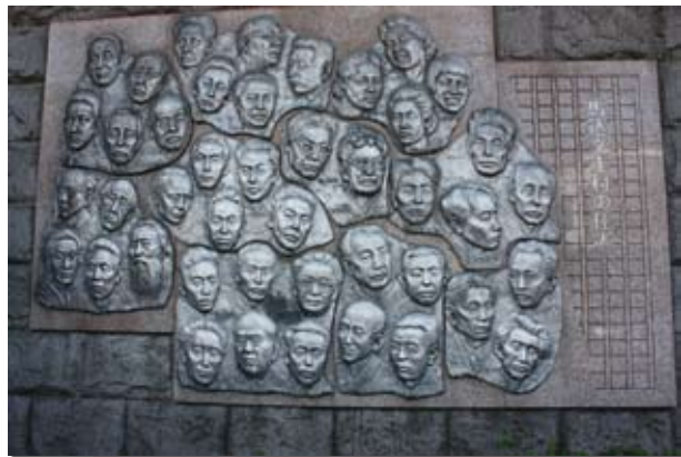
馬込文士村の住人たち(大森駅近くのレリーフ)