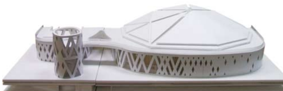
平成23年度開設予定の大田区総合体育館のイメージ