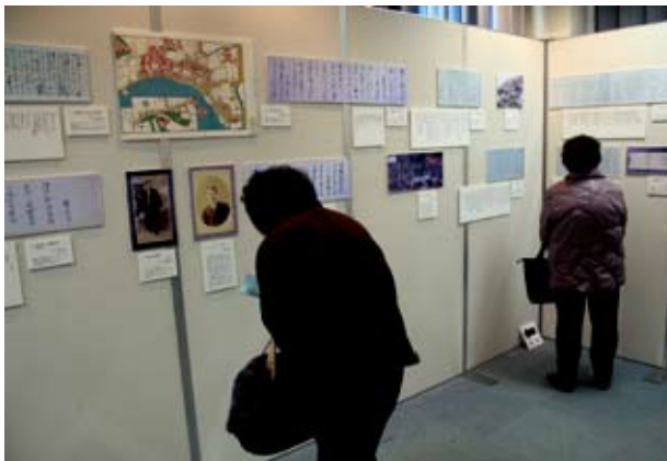
洗足池図書館が主催した勝海舟展