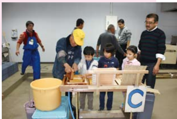
海苔のふるさと館での海苔つけ体験