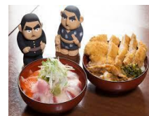
「勝丼」「せご丼」イメージ

勝海舟と西郷隆盛の会見が行われたとされる池上本門寺松濤園周辺の商店街では鹿児島の食材を使った「せご丼」、勝海舟が愛した洗足池周辺の商店街では創意工夫を凝らした「勝丼」を開発し、下記店舗にて期間限定で提供します。丼提供店舗には、本キャンペーンのタペストリーまたはミニのぼり旗を設置しています。