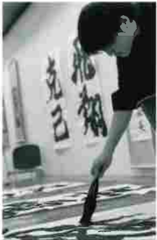
体験型アート書道